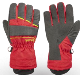
CRYSTAL Evo Red