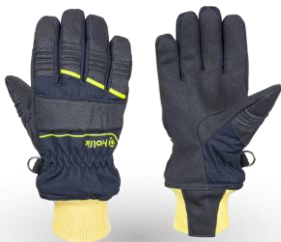
CRYSTAL Short Navy Blue