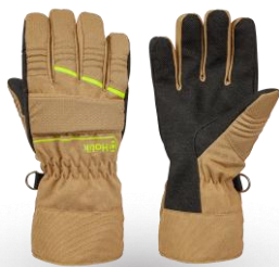
CRYSTAL Easy Beige