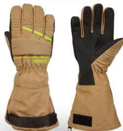
CRYSTAL Long Beige