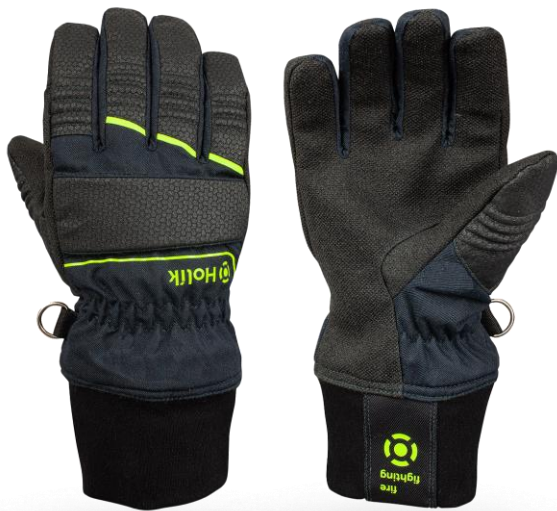
CRYSTAL Flexi Navy Blue